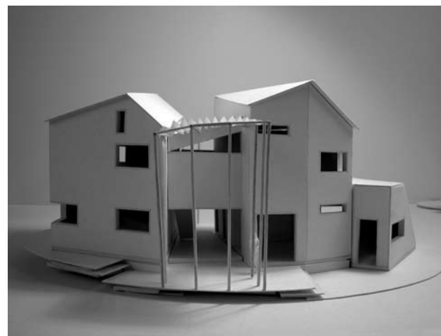
DET SAMMENSATTE HUS Typehus for et ikke-standardiseret liv, udformet i samarbejde med arkitekterne C Benixen, M C Trabut-Jørgensen, B Lauridsen og J M Schül Overgaden 2005