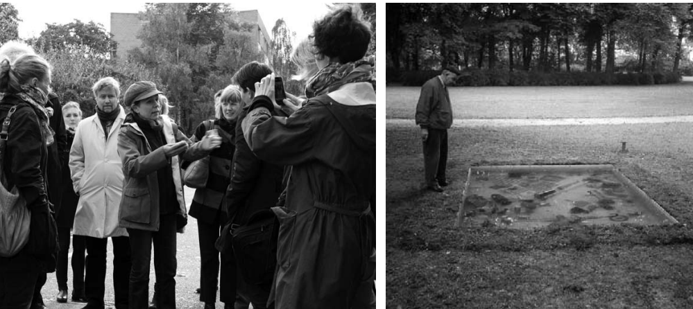
PARKENS ANATOMI Kildeparken, Aalborg 1993