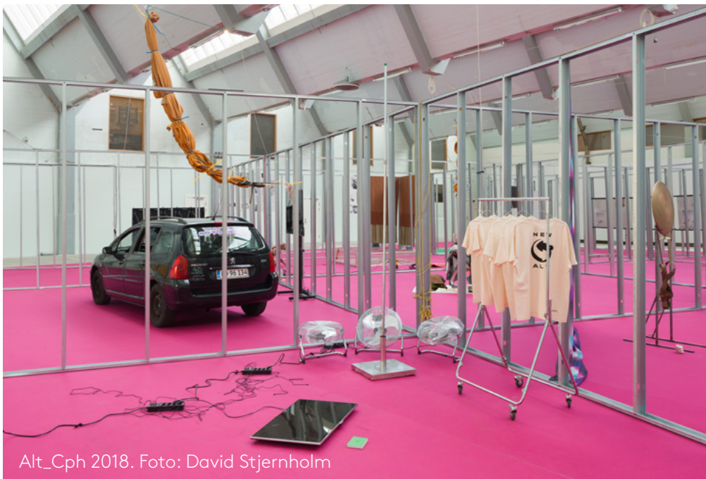
Alt_Cph 2018.