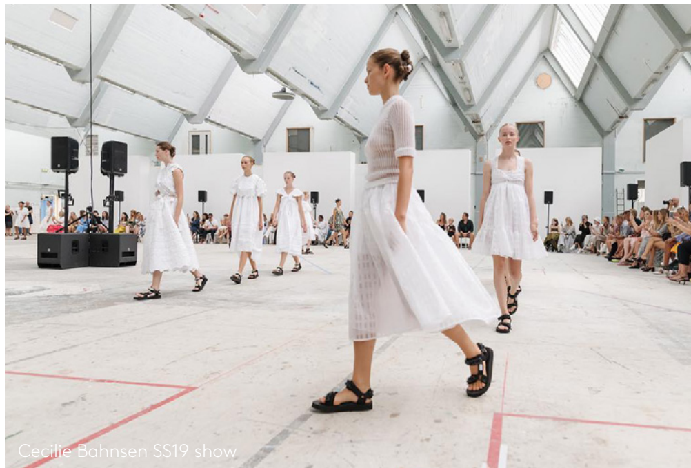
Cecilie Bahnsen SS19 show