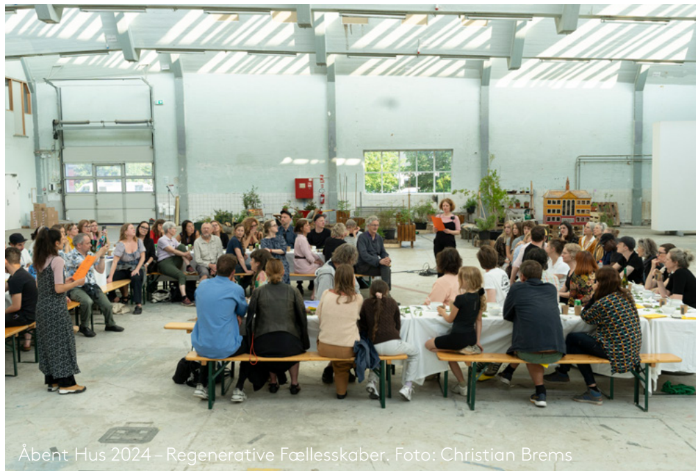
Åbent Hus 2024 – Regenerative Fællesskaber.